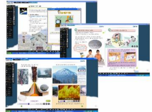
<Large scale digital content>

* As a full set of digital textbook it contains all resources and tools i.e, size of one subject for one semester is 3 GB