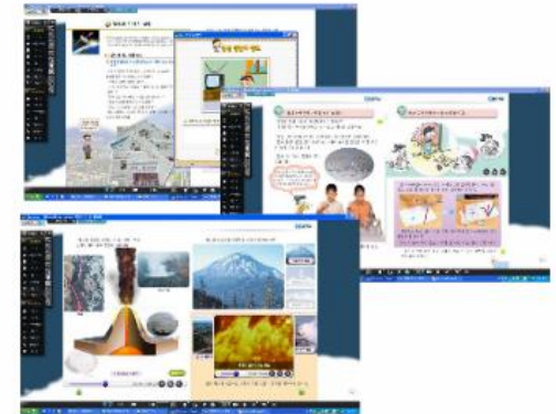
<Large scale digital content>

* As a full set of digital textbook it contains all resources and tools i.e, size of one subject for one semester is 3 GB